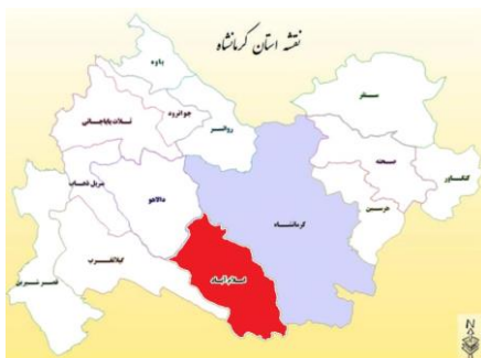
(نقشه موقعیت شهرستان در استان)