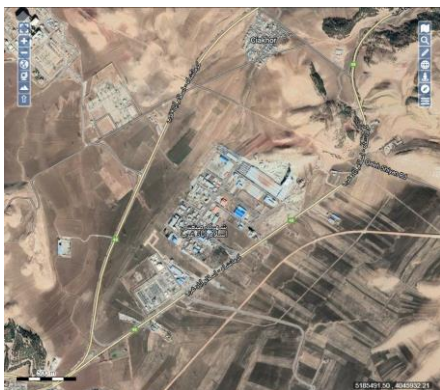
(نقشه موقعیت پروژه)