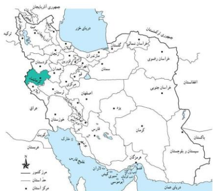
(نقشه موقعیت استان در کشور)